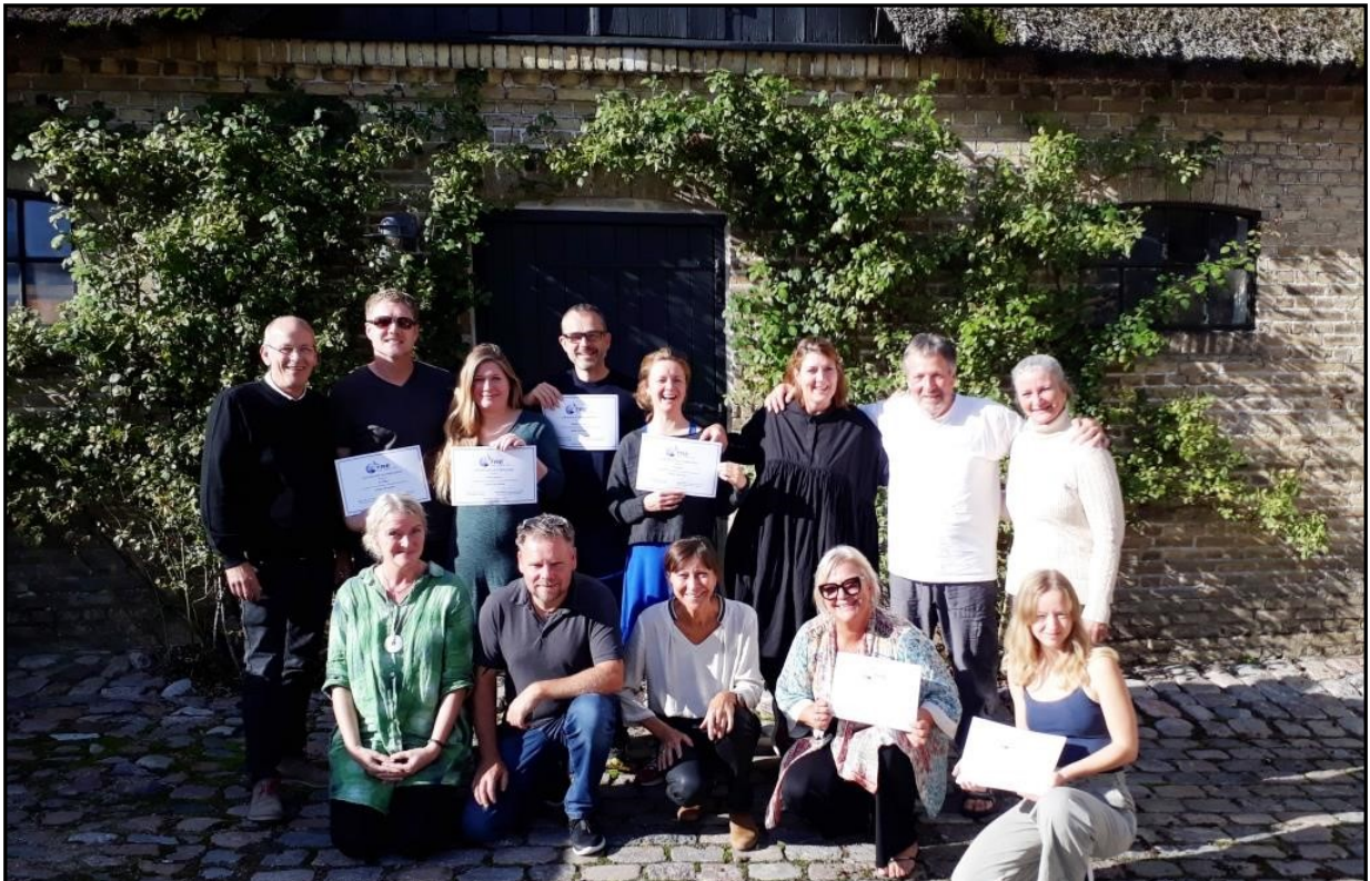
Sep. 2019: Nyuddannede TRE—providers i

Det er obligatorisk at deltage i al undervisning.